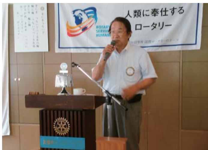
相澤前年度地区増強副委員長